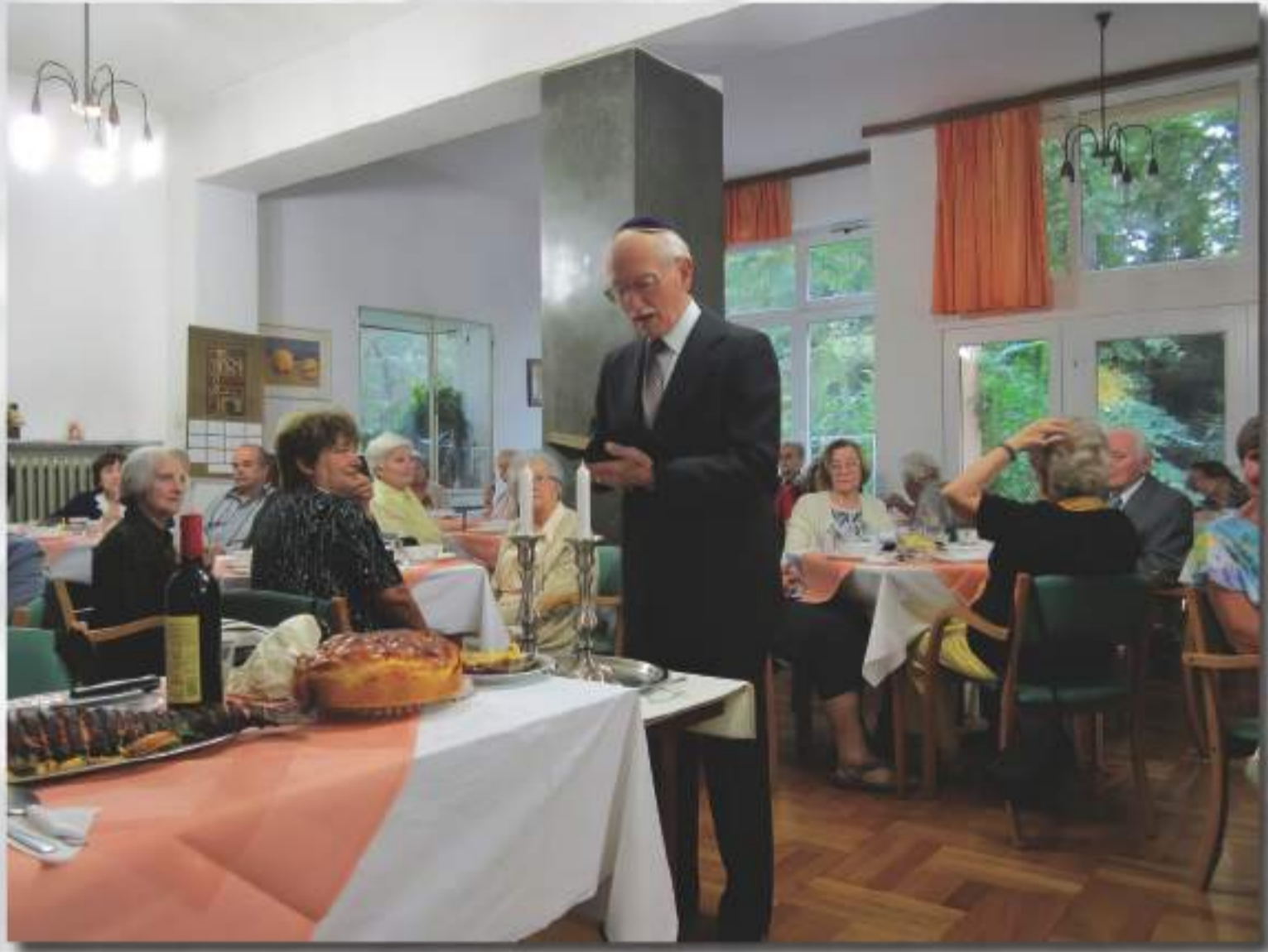
Šabat u prostorijama Doma