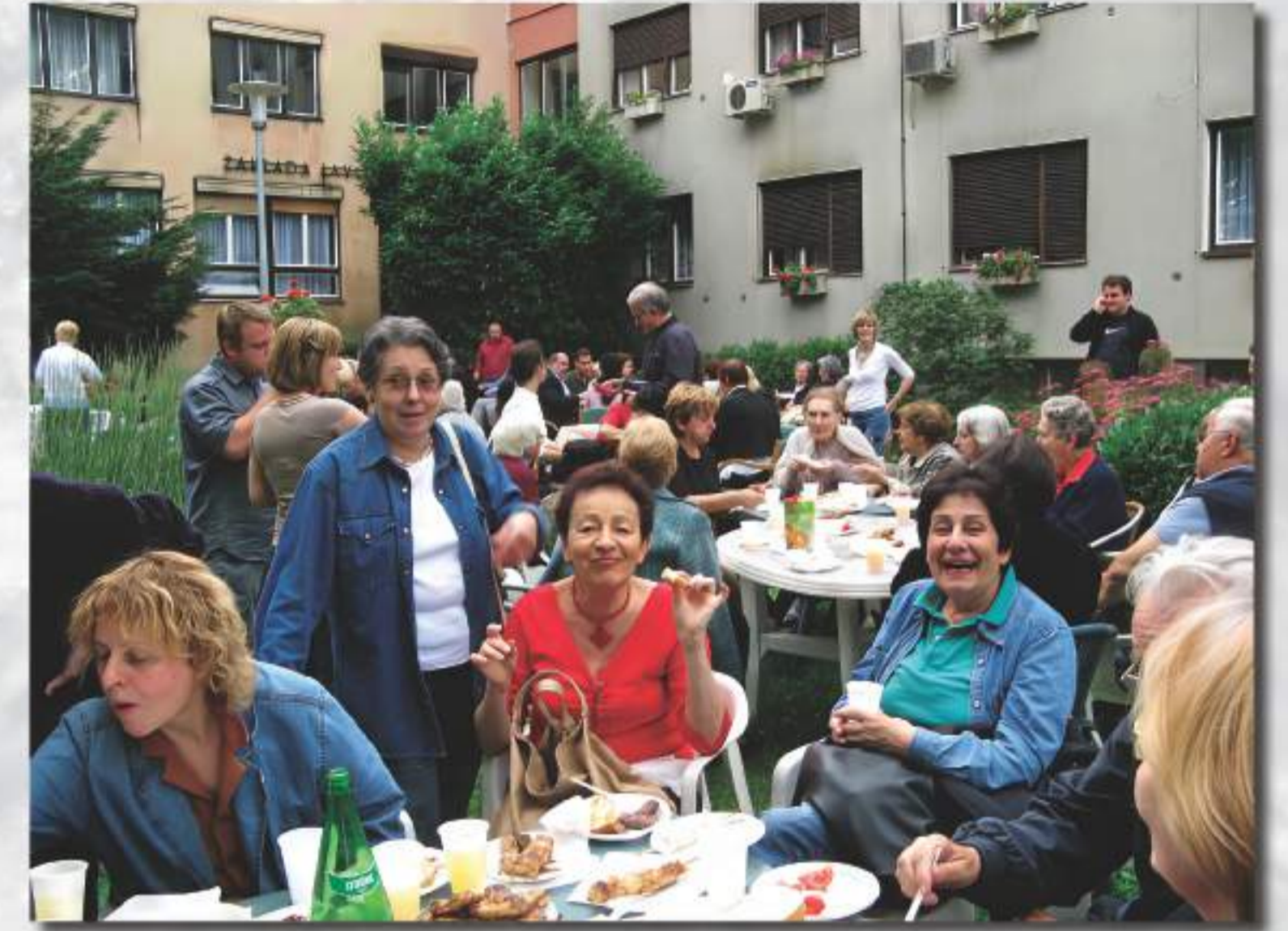
Druženje u vrtu Doma