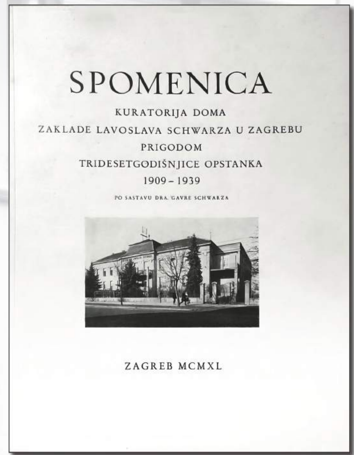
Spomenica prigodom 30 godina Schwarzovog doma iz 1940. g.