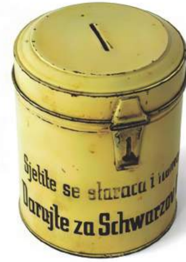
Kasica za priloge za izgradnju staračkog doma