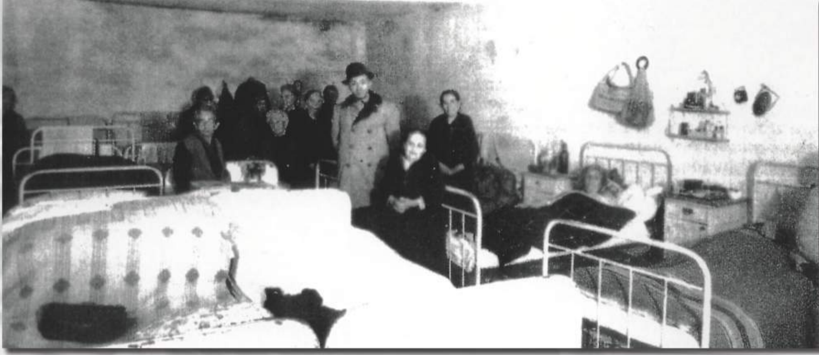
Smještaj štićenika Doma u Brezovici 1943. g.

U domu „Lavoslav Schwarz“ 1941. godine bilo je 100 štićenika, 78 žena i 22 muškarca. Već su 9. travnja 1941. godine, nakon ulaska Nijemaca u Zagreb, stanari morali napustiti Dom u roku od 24 sata, pri čemu nisu smjeli ponijeti ni svoje osobne stvari. Neki su se smjestili kod rodbine, a neki u improvizirane prostorije stanova u Rapskoj ulici (nikada se nije saznalo za njihovu sudbinu) i Boškovićevoj ulici broj 3. Stanari u Boškovićevoj ulici i nekoliko njih koji su, teško bolesni, ostali privremeno u podrumu Doma, premješteni su u dvije osamljene kućice u Stenjevcu kraj Zagreba, gdje su živjeli u teškim uvjetima i opasnosti sve do prosinca 1943. godine. Nekoliko je pojedinaca odvedeno i nikada se nije saznala njihova sudbina. Preostalih 60 štićenika 8. prosinca 1943. godine prebačeno je iz Stenjevcu kamionima u Brezovicu (imanje kardinala Štepinca) u malu kućicu, koja je kasnije nadograđena, a o njima se brinula Židovska općina Zagreb. Rat je preživjelo 52 štićenika (8 muškaraca i 44 žene).