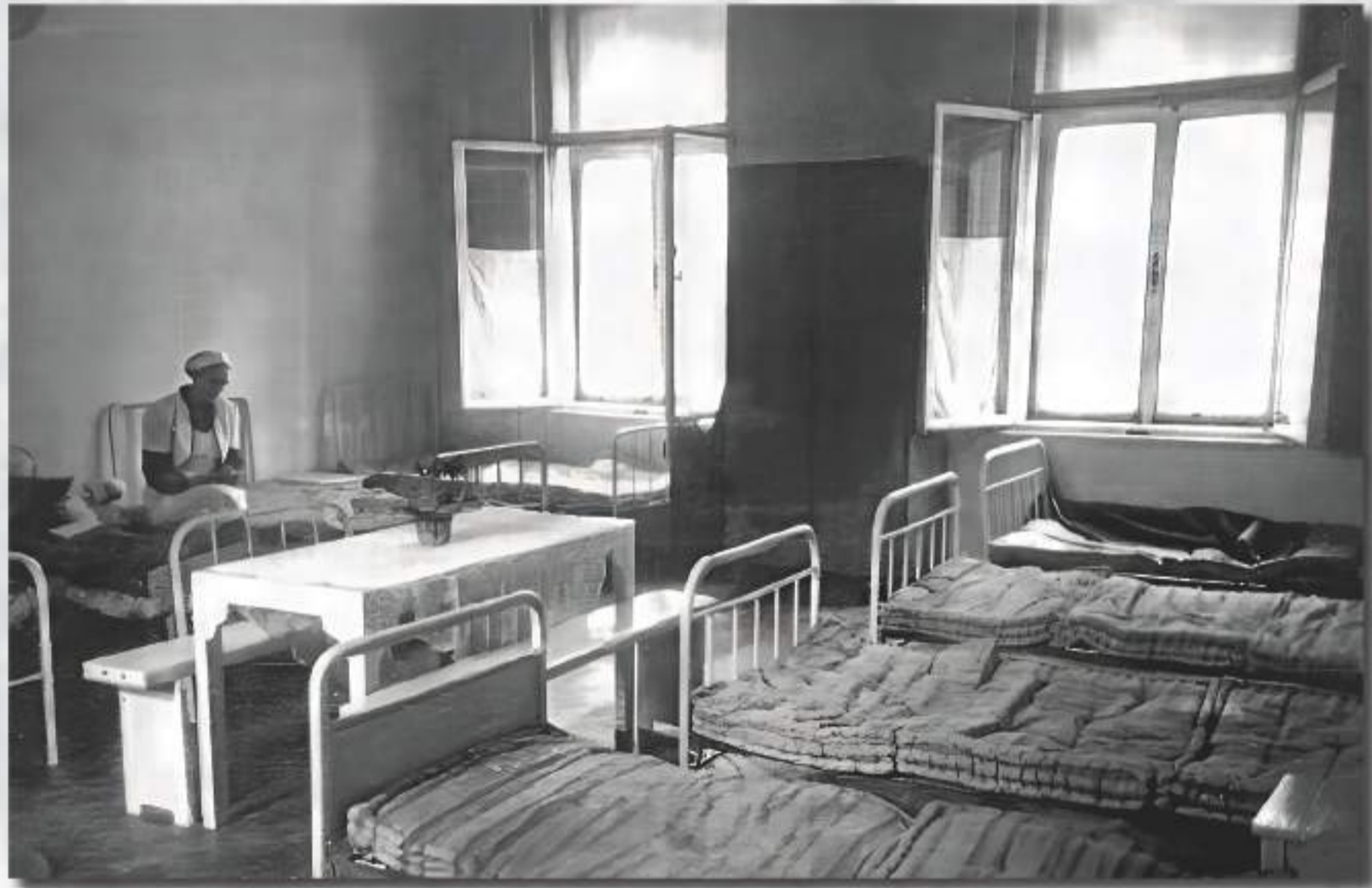
Improvizirana bolnica za preživjele u Palmotićevoj ulici

Nakon rata, preživjele starije osobe, bez ikoga i ičega, potražile su smještaj u Domu. Židovska općina u Zagrebu je zbog velikih potreba ustupila dva kata svoje zgrade u Palmotićevoj ulici 16, a osigurana je besplatna prehrana iz Doma. Unutar Židovske općine formiran je odbor za izgradnju Doma za smještaj 114 osoba, prema nacrtu arhitekta Slavka Löwy-a. Izgradnja Doma financirana je sredstvima dobivenim za zgradu u Maksimirska ulici, donacijama JOINT-a, akcijom prikupljanja sredstava od Saveza židovskih općina Jugoslavije i drugim donacijama. 15. prosinca 1957. godine obavljena je svečana primopredaja nove zgrade u Bukovačkoj ulici.