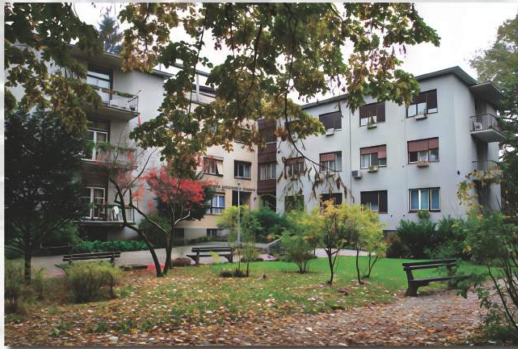
Novi dom zaklade Lavoslava Schwarzza u Bukovačkoj ulici