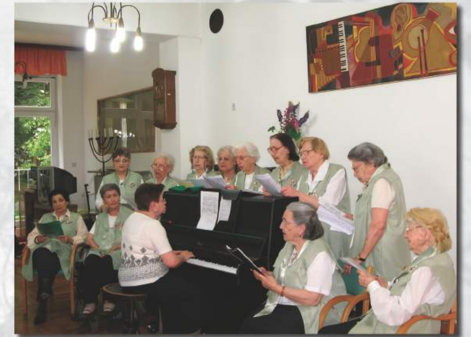
Pjevački zbor Doma