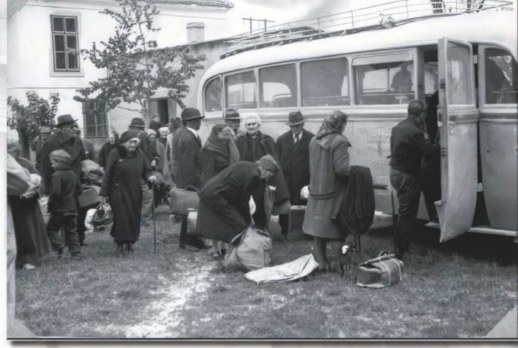
Povratak štićenika Doma iz Brezovice nakon rata