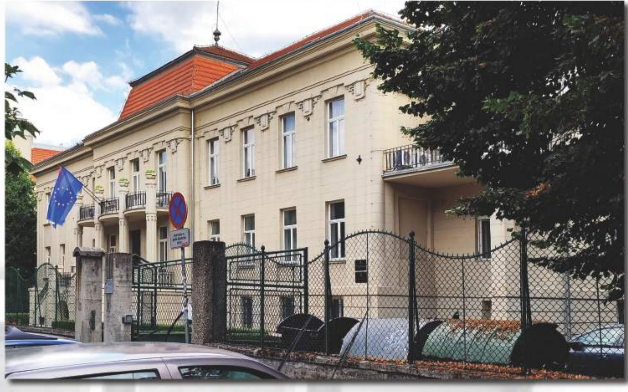
Zgrada u Maksimirska ulici u kojoj se nekad nalazio dom „Lavoslav Schwarz“