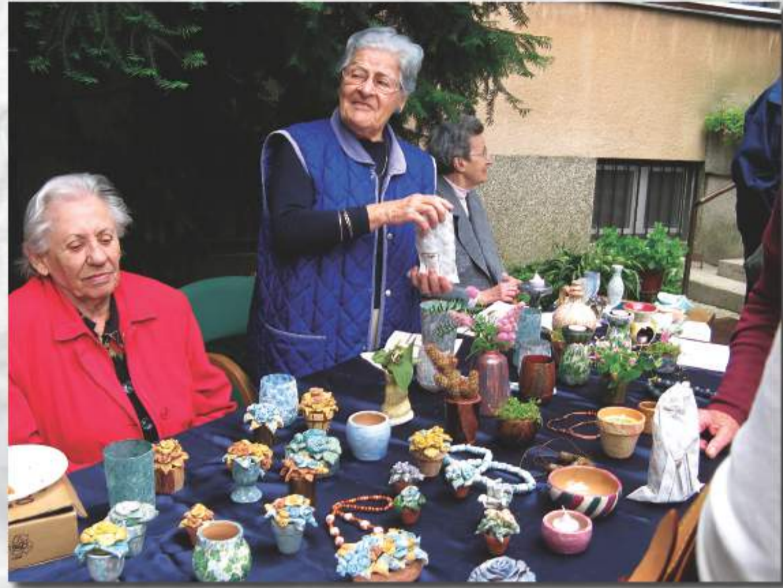
Izložba radova keramičke grupe